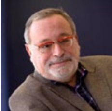
Fernando Savater Twitter: @Fernando Savater